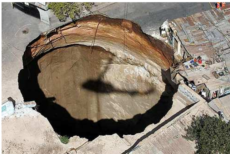
Questo buco, creatosi in Guatemala ha letteralmente inghiottito almeno un dozzina di case, abitanti inclusi.