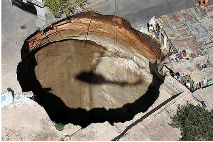
Questo buco, creatosi in Guatemala ha letteralmente inghiottito almeno un dozzina di case, abitanti inclusi.