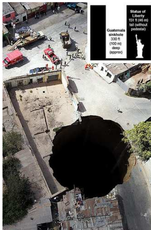
Creato semplicemente dal risucchio dell'acqua piovana causato dal collasso della superficie terrestre.