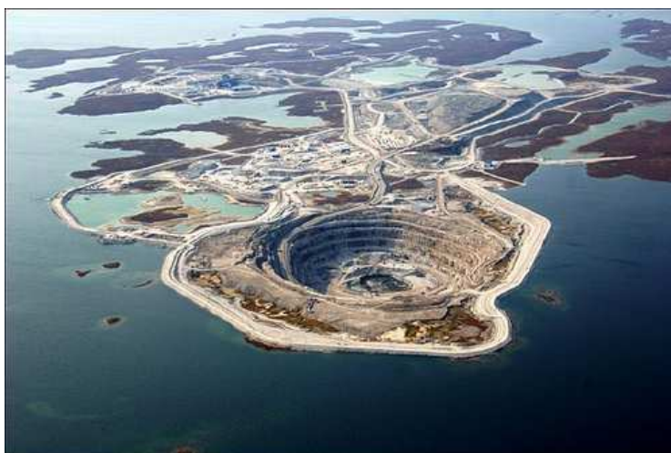
Questa incredibile miniera si trova a 300km a nord-est di Yellowknife in Canada.