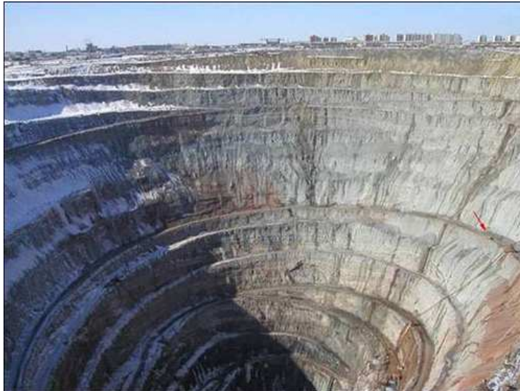
La freccia rossa a destra, punta un grosso camion per il trasporto terra.