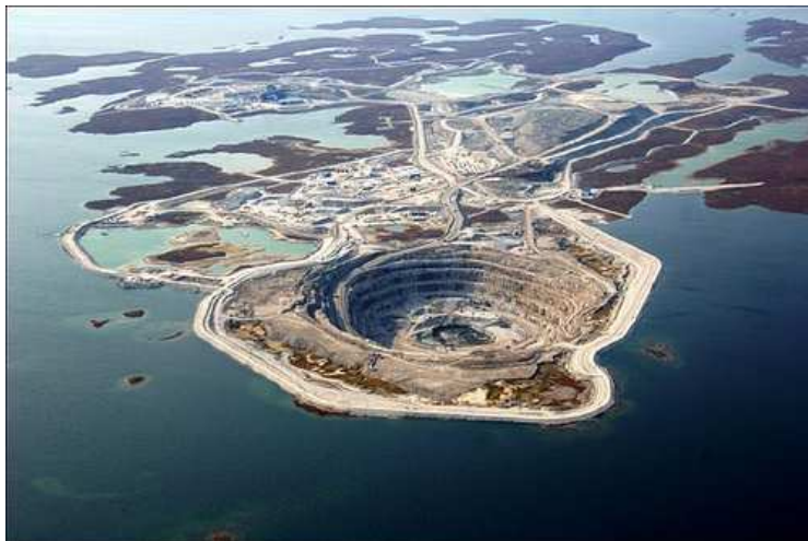
Questa incredibile miniera si trova a 300km a nord-est di Yellowknife in Canada.